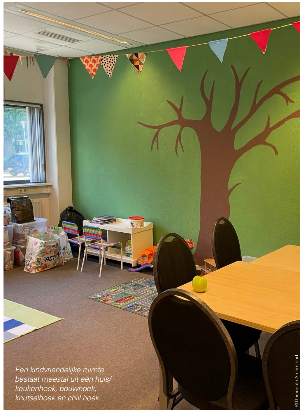
Een kindvriendelijke ruimte bestaat meestal uit een huis/keukenhoek, bouwhoek, knutselhoek en chill hoek.

Zelfs als een opvang maar een paar maanden open is, is er met een kindvriendelijke ruimte al een groot verschil te maken voor een kind. Het biedt kinderen een eigen plek om heen te gaan, het geeft rust en regelmaat waardoor ze zelfs in een korte periode de kans krijgen even los te zijn van de zorgen van hun ouders en kind te kunnen zijn.