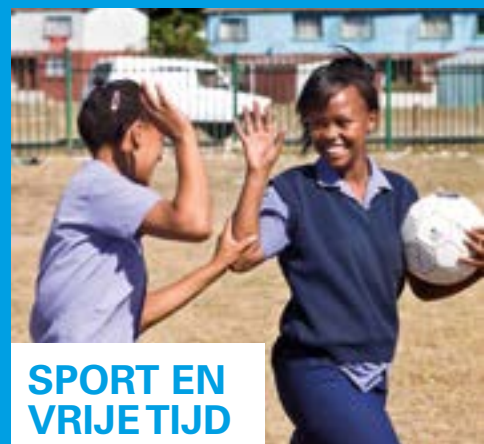
SPORT EN VRIJE TIJD