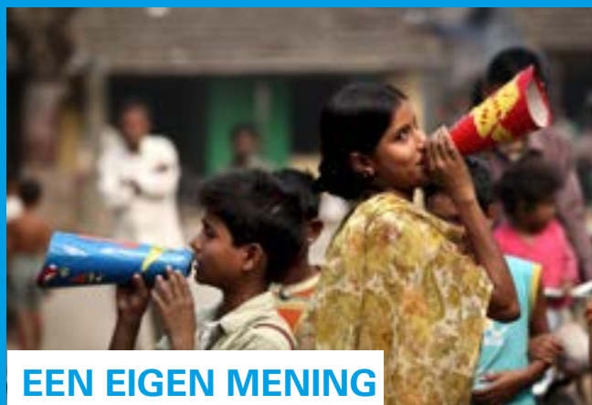
EEN EIGEN MENING