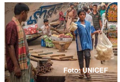
Nur werkt als verkoper op straat