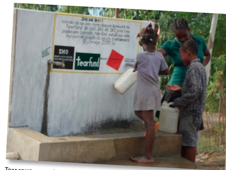
Tear zorgt voor schoon drinkwater door het slaan van waterputten en de aanleg van goede sanitaire voorzieningen

Bekijk hier hoe jongeren die een arm of been verloren bij de aardbeving, de draad van hun leven weer oppakken Bekijk het filmpje.