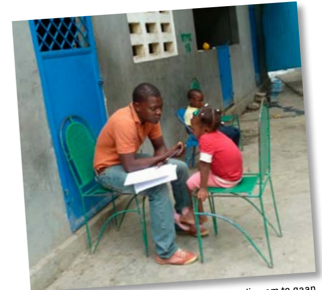
Kinderen leren via traumaverwerking met verlies om te gaan

SHO-deelnemers besteden ook aandacht aan de geestelijke gezondheidszorg. Het Leger des Heils steunt een project waar kinderen en jongeren leren omgaan met verlies. Dat kan het verlies zijn van hun huis, maar ook van familieleden of leeftijdsgenootjes. Ouders en verzorgers worden actief bij het project betrokken. Getrainde veldwerkers helpen de kinderen bij het verwerken van hun trauma en leren kinderen weer te spelen en contact te leggen met andere kinderen.