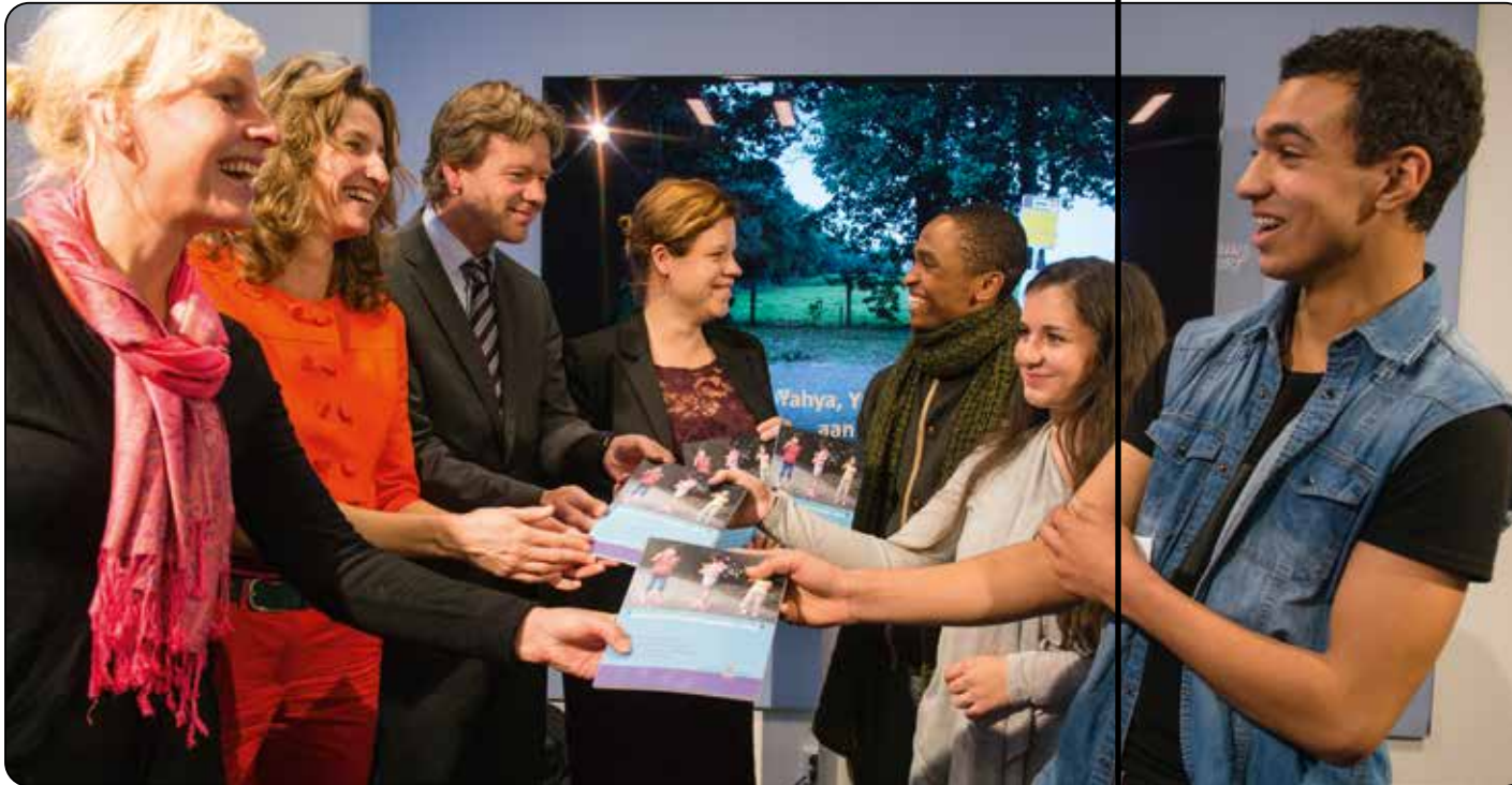
Op 5 november 2014 overhandigden jongeren uit gezinslocaties het rapport 'Het is hier in één woord gewoon... stom!' aan leden van de Tweede Kamer.

Het VN-Kinderrechtencomité benadrukt dat het recht om gehoord te worden niet voortvloeit uit het feit dat kinderen kwetsbaar zijn of afhankelijk van volwassenen. Het geeft kinderen eigen rechten. Daarom moet het mogelijk zijn voor kinderen en jongeren om naar gelang hun leeftijd inspraak te hebben, invloed uit te oefenen, zaken goed te keuren, of juist af te keuren.